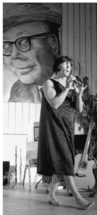
Karaoke: Gnnann/Mireille Mathieu.

denzeit für sich entdeckt und lässt andere an dieser Ausgrabung mit Freuden teilhaben. Er zitiert, fabuliert, schwadroniert, grimassiert, chargiert... Erhardts Gedicht von der Kuh auf der saftig-grünen